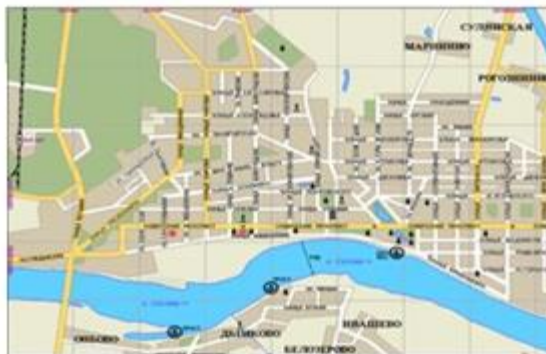
а) Компактная планировка