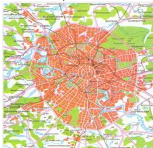
б) Кольцевая планировка

Результаты: Анализируются наиболее значимые для сохранения здоровья человека факторы городской среды, определяется соответствие городской среды гигиеническим требованиям, комплексно анализируется степень благоприятности среды обитания для человека.